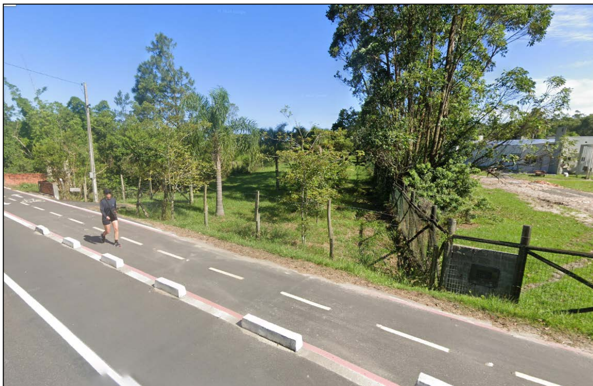
Figura 3: Local de implantação da drenagem.