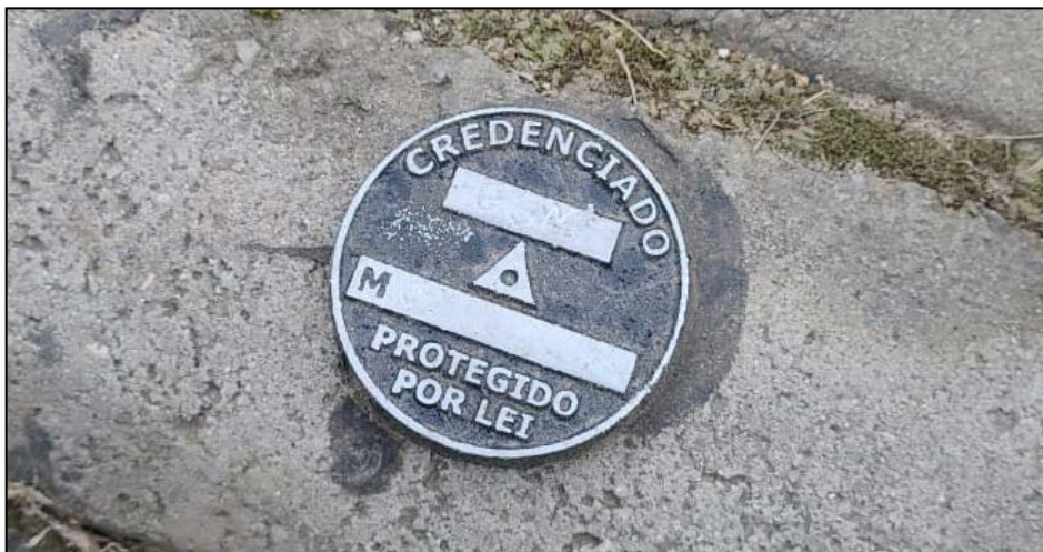
Figura 4: Pino implantado no local de projeto.

A Figura 4 apresenta um modelo de pino implantado no local de projeto.