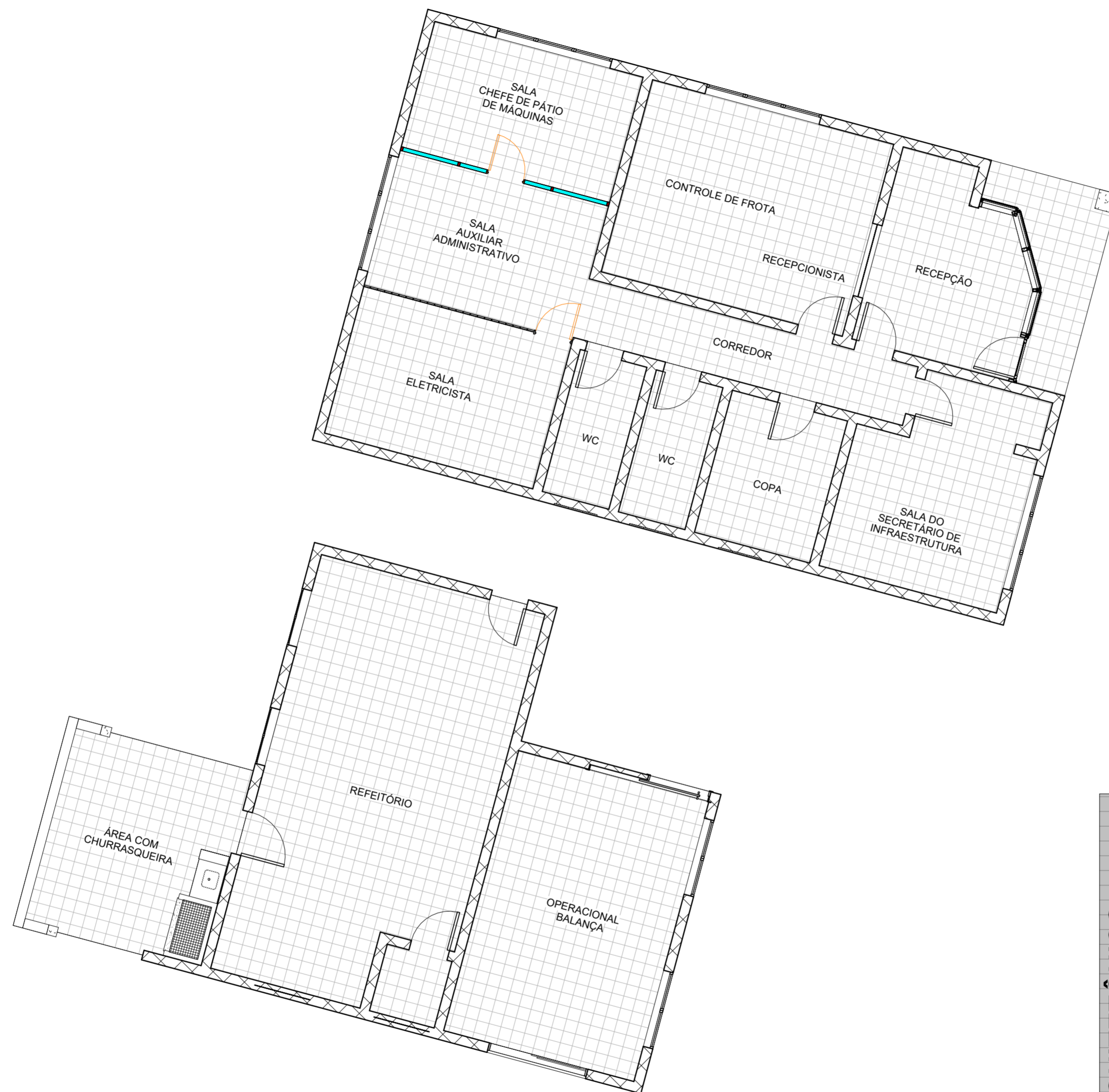
1 PLANTA BAIXA SALAS 1 : 100