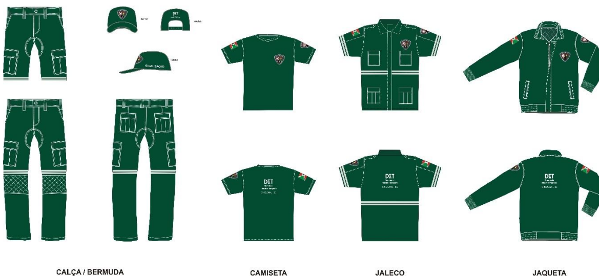
CALÇA / BERMUDA