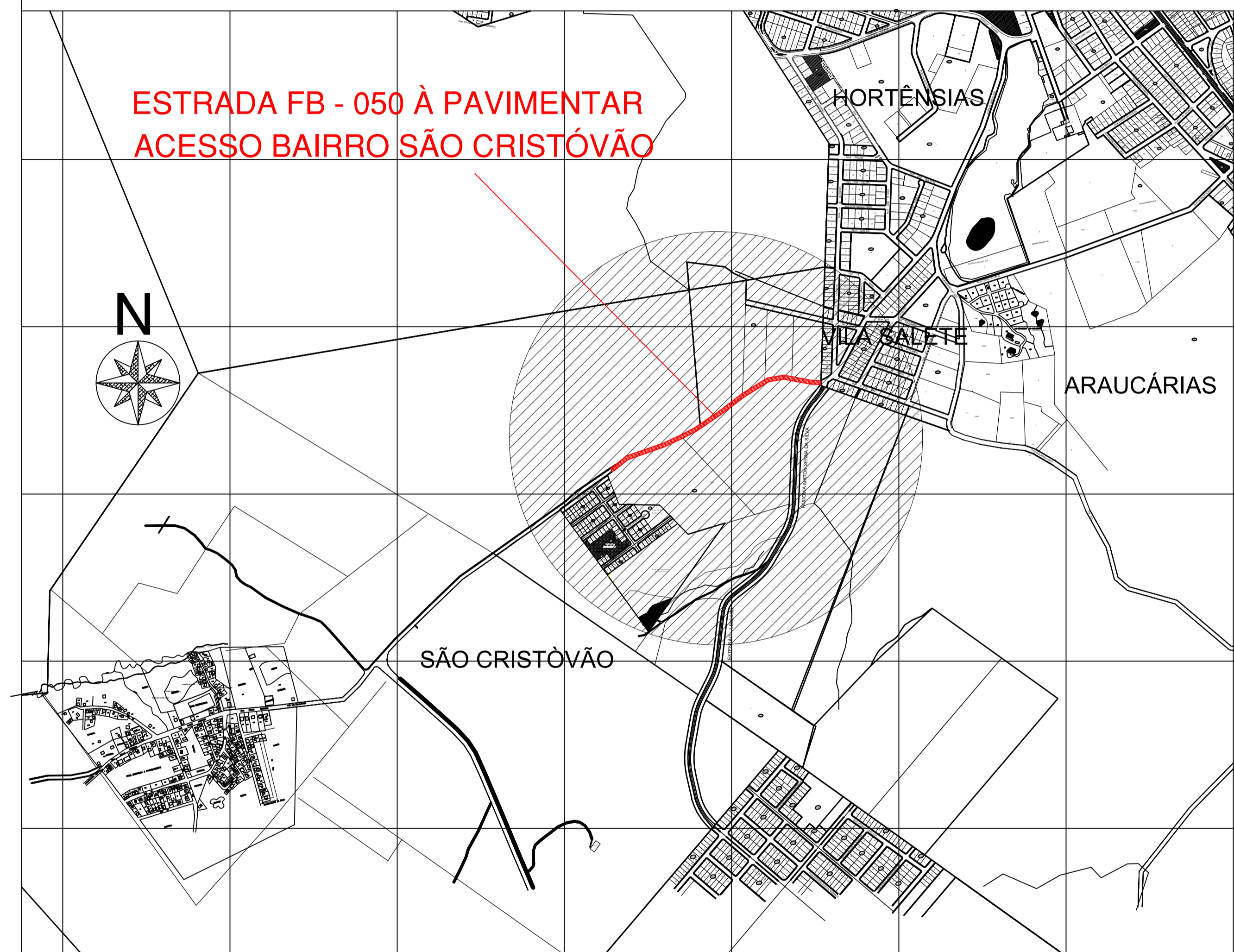
LOCALIZAÇÃO / BAIRRO Escala 1 / 10.000