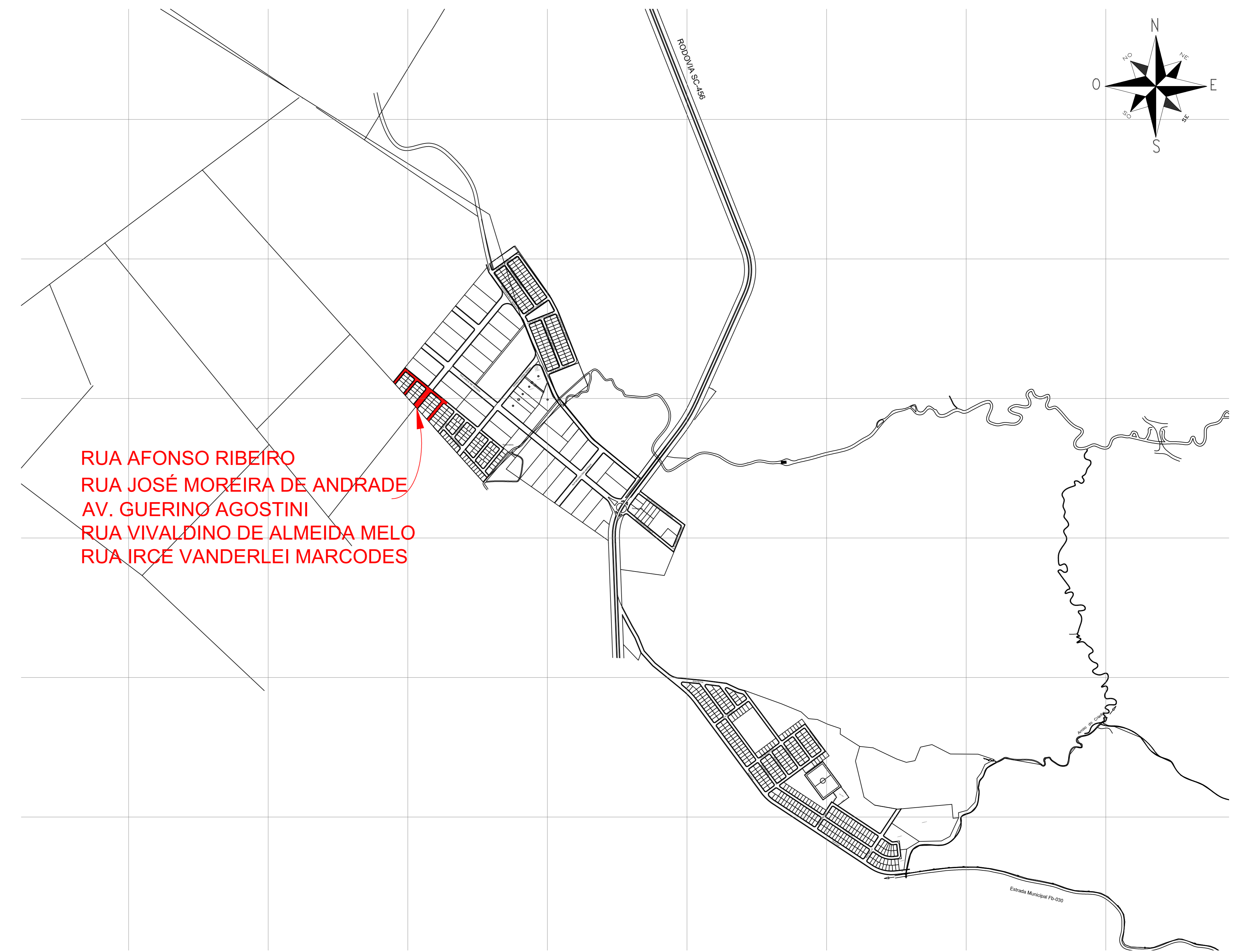
Planta de Localização/Bairro sem escala