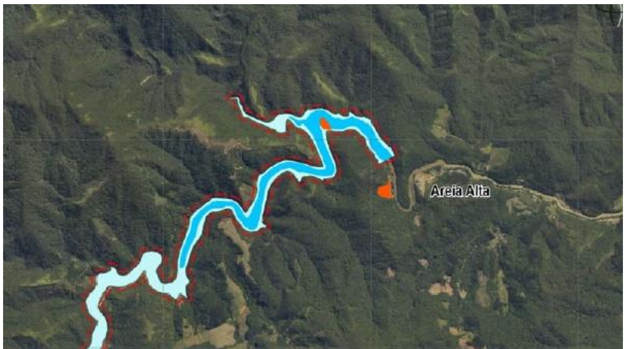
Localização da Barragem de Botuverá -SC

Este estudo mostrou a necessidade de execução de vários trabalhos a serem realizados nessa bacia e uma das indicações é a construção de várias barragens e uma delas é a Barragem no Rio Itajaí Mirim no município de Botuverá como será descrito neste Termo de Referência e Memorial Descritivo e mostrado nas figuras abaixo: