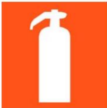
Figura 1 - pictograma indicativo de extintor de incêndio

Art. 18. Para a sinalização de parede, deve ser instalada placa com o pictograma da figura 1, conforme NBR 16820, imediatamente acima do extintor.