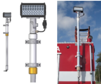
Imagens 1 e 2 de mastros de luz manuais similares aos pretendidos (imagem meramente ilustrativa)

1.43.1.5. Deverá possuir dispositivo que permita a movimentação manual dos refletores na extremidade do mastro, de rotação e inclinação;