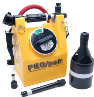
FIGURA 1 – MODELO DE EQUIPAMENTO PORTÁTIL PARA FORMAÇÃO DE ESPUMA SIMILAR AO PROPOSTO.