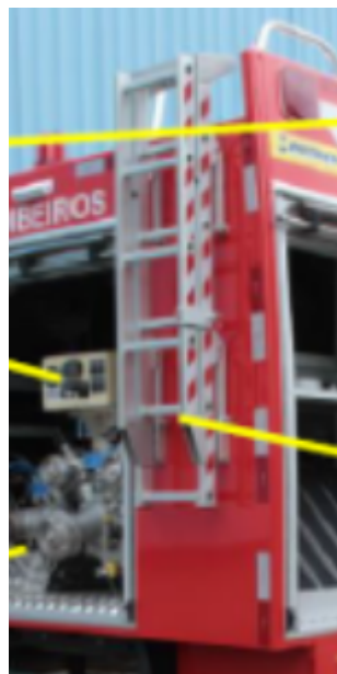
Imagens de escada dobrável pretendida para acesso ao convés