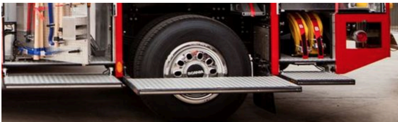
Figura demonstrativa de Estribos dobráveis pretendidos

1.17.13. Os estribos dobráveis deverão possuir sistema de amortecedores pneumáticos compatíveis, que não permitam que os estribos abram durante deslocamento. Poderá ser admitido o uso de sistemas de acoplamento manual, a fim de assegurar o fechamento hermético dos estribos (desde que aprovado no projeto pelo fiscal);