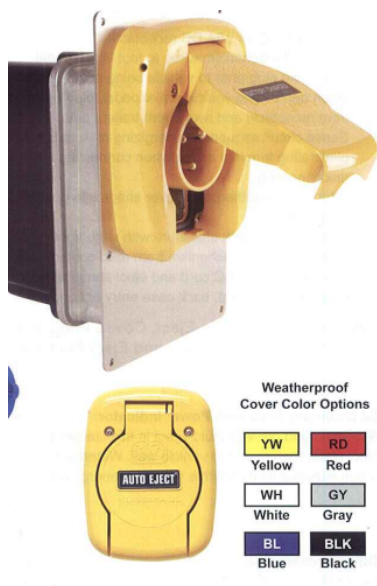
Figura ilustrativa modelo de conexão elétrica do carregador de baterias

1.16.4. A instalação da tomada inject, deverá ser priorizada na parte traseira do implemento, de fácil acesso ao operador ao nível do solo e de preferência do lado direito da persiana traseira;