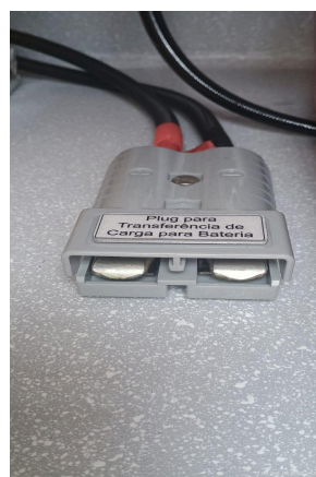
Imagens ilustrativas de "plug's" (modelo) pretendido, para transferência de carga