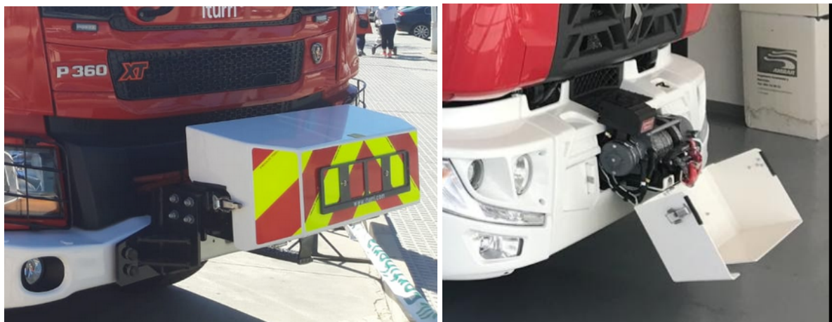
Imagens ilustrativas do modelo de tampa de guincho pretendida