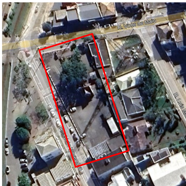
Imagem 01: Localização do terreno.

A construção de uma nova praça coberta no centro da cidade tem como objetivo criar um espaço público estruturado para a realização de eventos, feiras, atividades culturais e encontros da comunidade. A implantação dessa infraestrutura proporcionará maior conforto e acessibilidade à população, incentivando a convivência social, o lazer e a valorização da cultura local. Além disso, a praça coberta contribuirá para a dinamização do centro urbano, estimulando o comércio local, fortalecendo a identidade cultural do município e oferecendo um ambiente adequado para o desenvolvimento de atividades sociais, culturais e recreativas ao longo de todo o ano.