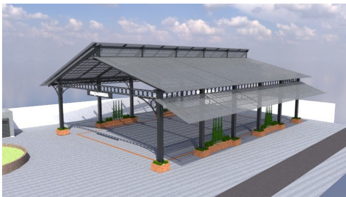
Imagem 02: Praça coberta

Além de proporcionar à sociedade Fumacense um espaço público representativo, contribuindo para o fortalecimento da convivência social, da participação cidadã e das práticas democráticas no município.