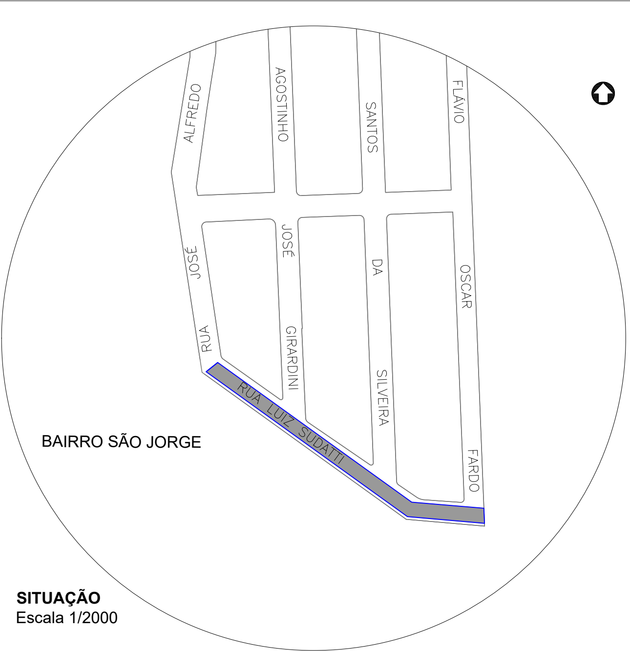
SITUAÇÃO Escala 1/2000