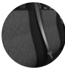
Bancos em tecido