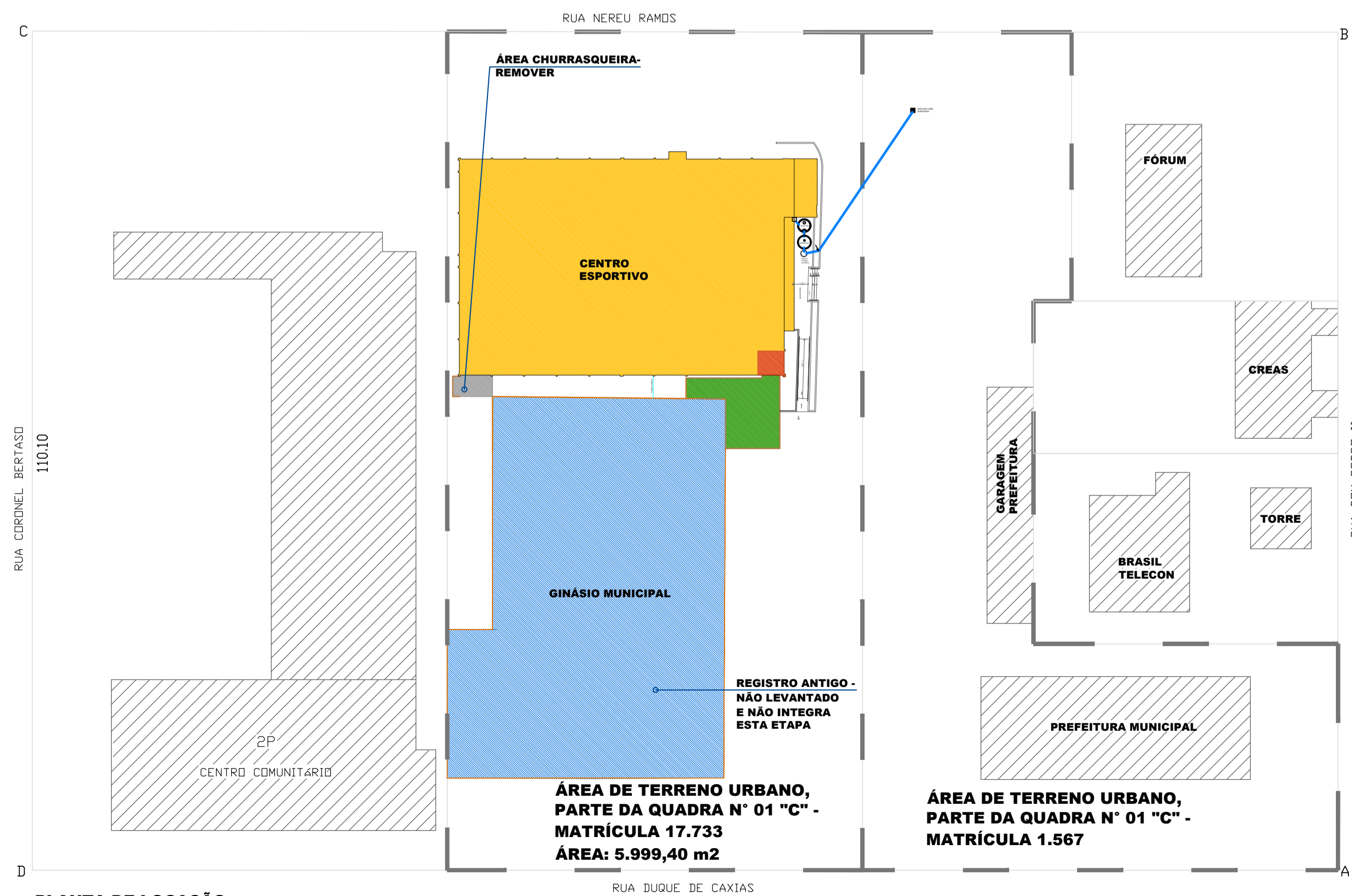
PLANTA DE LOCAÇÃO Escala: 1/500