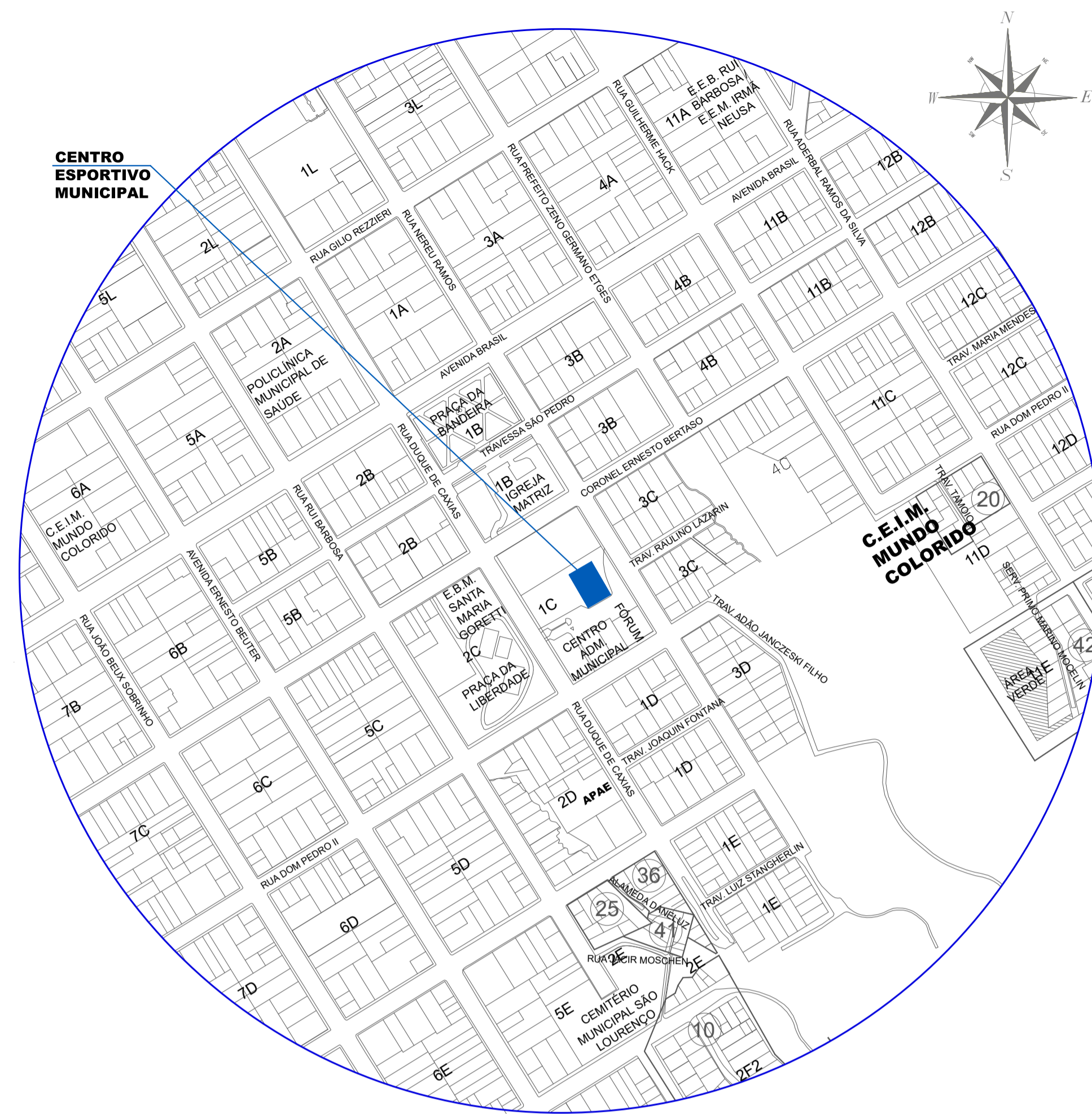
PLANTA DE SITUAÇÃO Escala: 1/5.000