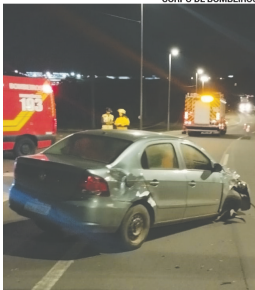
Colisão envolveu uma caminhonete Toyota Hilux e um Volkswagen Voyage

Apesar do impacto, o acidente resultou apenas em danos materiais de média monta nos veículos envolvidos. A Polícia Rodoviária Federal (PRF) esteve no local para realizar os procedimentos cabíveis e o controle do trânsito na rodovia.