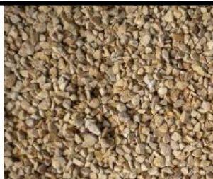
ARGILA EXPANDIDA/SAIBRO – Saco 50 litros

E-mail: gabinete.semurb@concordia.sc.gov.br