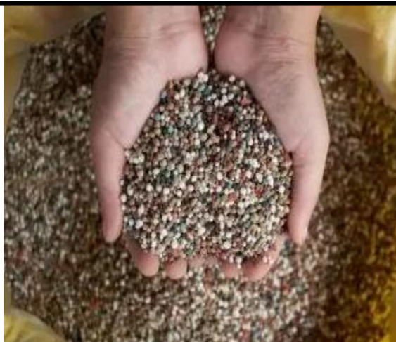
UREIA EM SACA DE 50KG

E-mail: gabinete.semurb@concordia.sc.gov.br