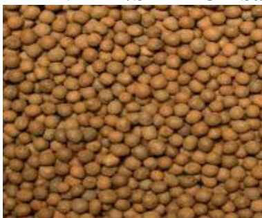
GRAMA SEMPRE VERDE