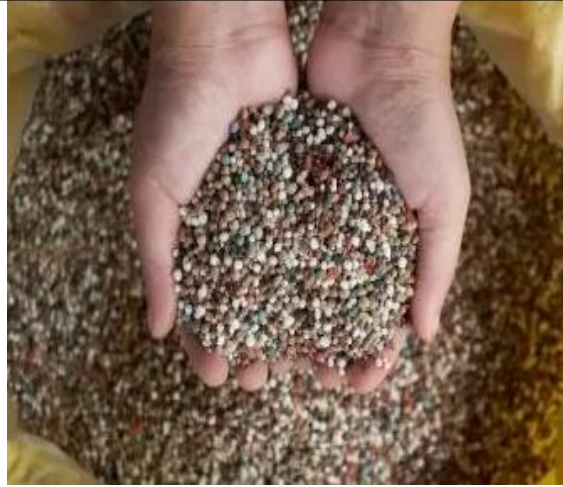
UREIA EM SACA DE 50KG

E-mail: gabinete.semurb@concordia.sc.gov.br