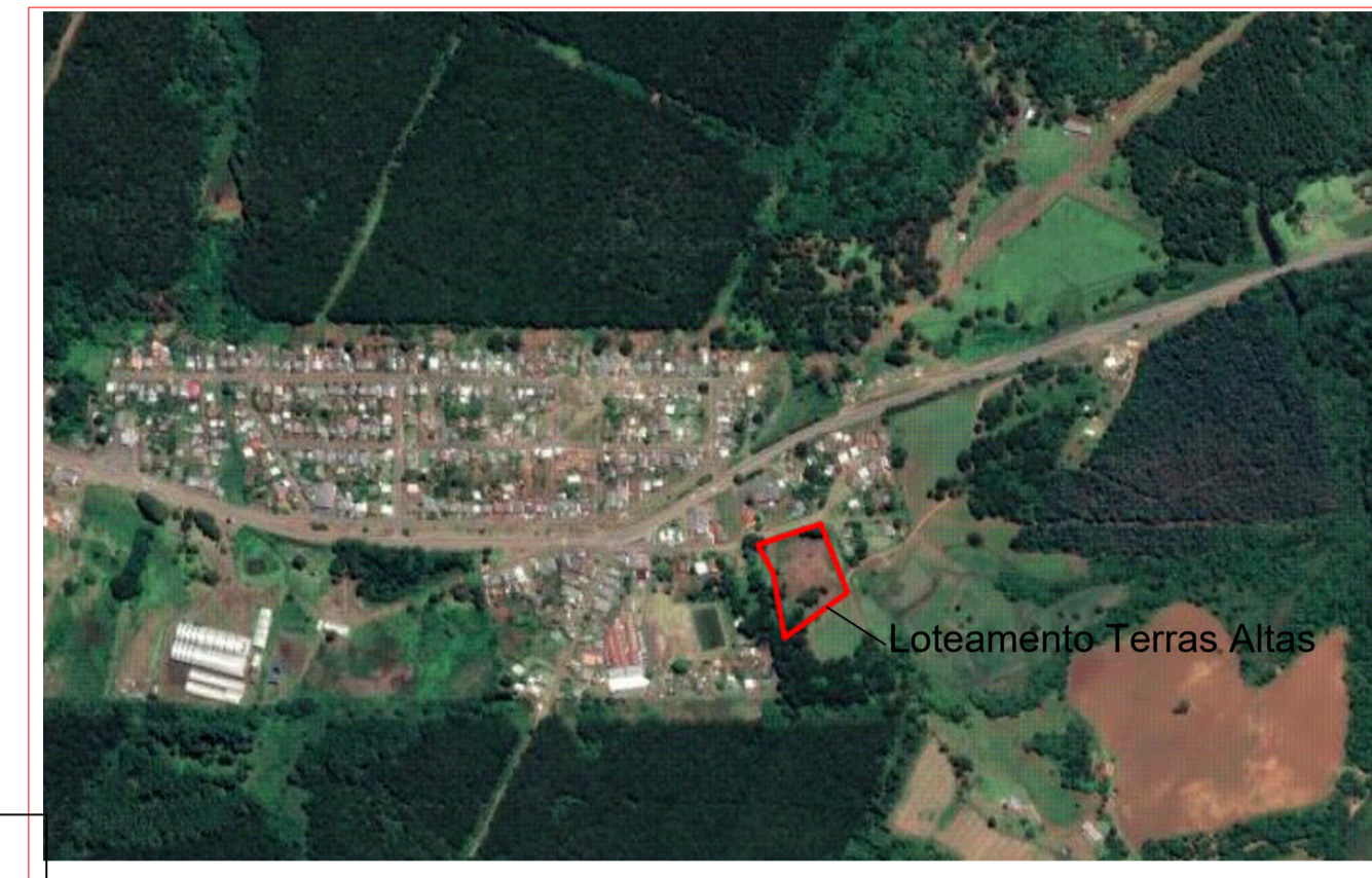
Planta de Localização - Distrito de Taquara Verde - Caçador-SC Sem Escala