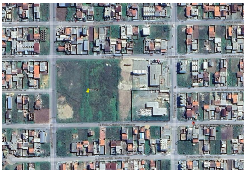
Figura 1: Localização da área de intervenção onde será implantada a Escola Municipal do loteamento Casa Nova