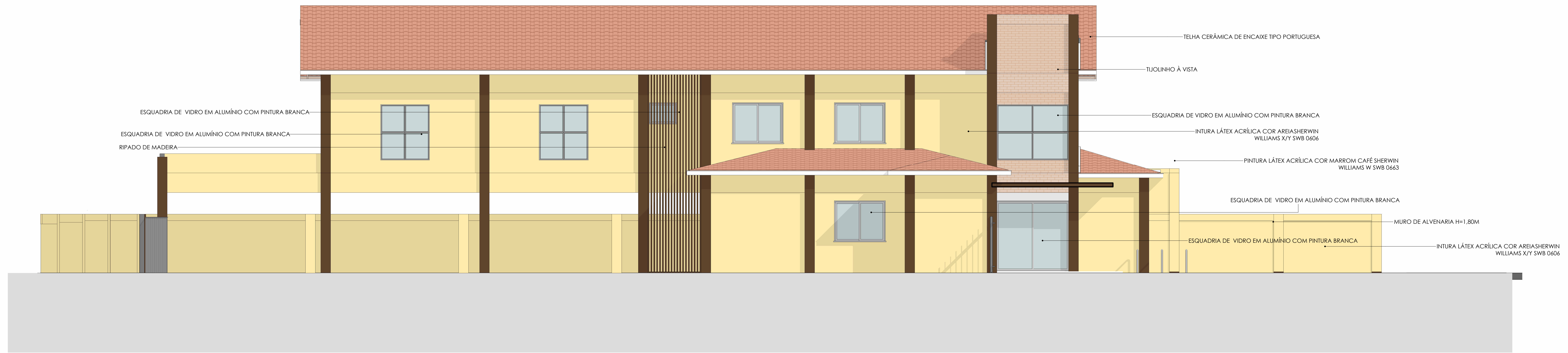
FACHADA LATERAL ESQUERDA ESC: 1 : 50