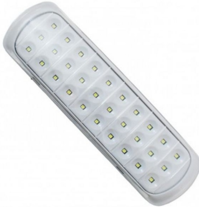
Bloco autônomo - 30 led, 90 a 100lumens