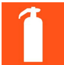
Figura 1 - pictograma indicativo de extintor de incêndio

Também deverá ser instalado sob o extintor, a 20 cm da base do extintor, um círculo com inscrição em negrito “PROIBIDO DEPOSITAR MATERIAL”, em vermelho e bordas em amarelo. O material a ser utilizado como suporte para fixação do extintor deverá ser instalado com previsão de suportar 2,5 vezes o peso total do aparelho a ser instalado, sendo que deverá ser instalado, no máximo, a 1,60m acima do piso acabado conforme detalhe em projeto.