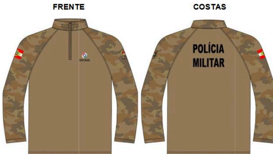
Ilustração Combat Shirt Verão Camuflada