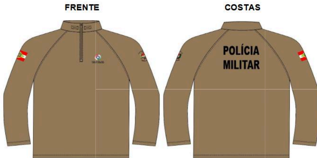
Ilustração Combat Shirt Verão Cáqui