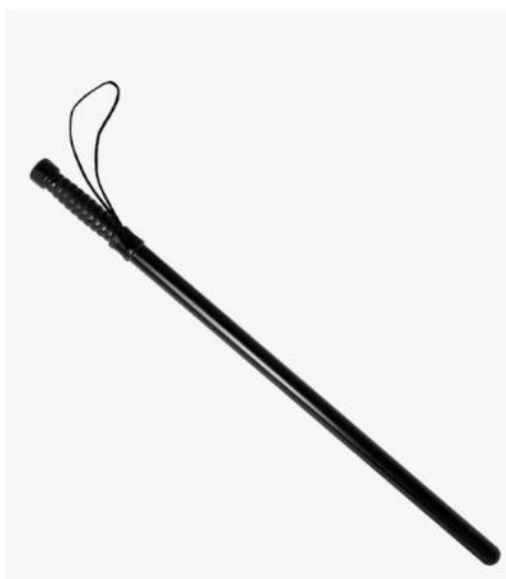
Ilustração Bastão Anti Tumulto