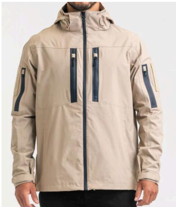
Ilustração Jaqueta Impermeável