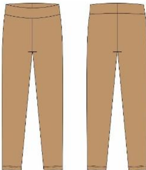
Ilustração Segunda Pele (parte inferior)