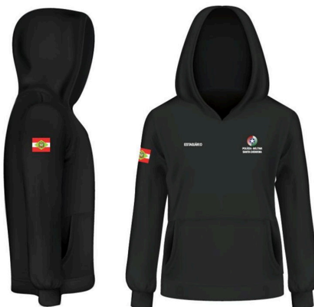
Ilustração Blusa Moletom Canguru