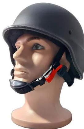
Ilustração Capacete Tático