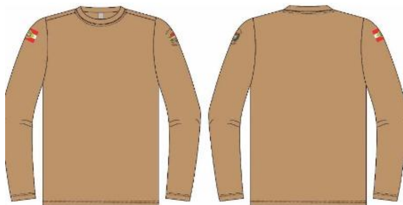
Ilustração Segunda Pele (parte superior)