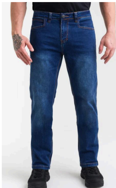
Ilustração Calça Operacional