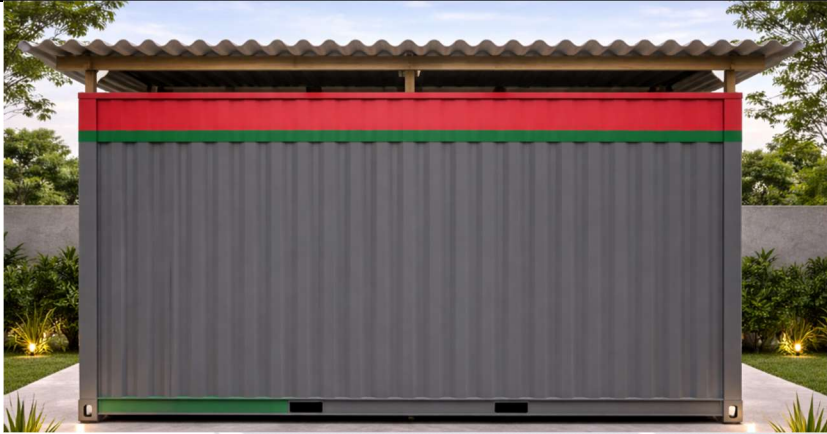
Exemplo da porta - duas folhas