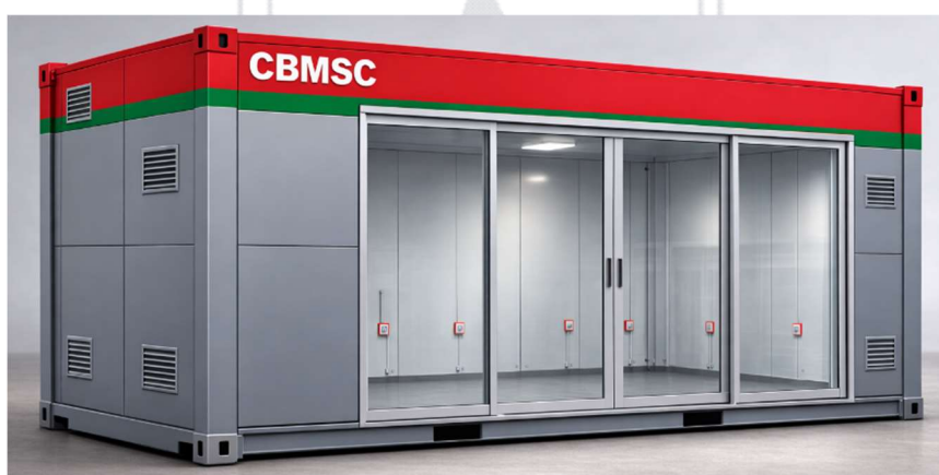
Imagem para visualização externa e interna com cobertura em madeira ou alumínio

Imagem para visualização externa e interna sem cobertura