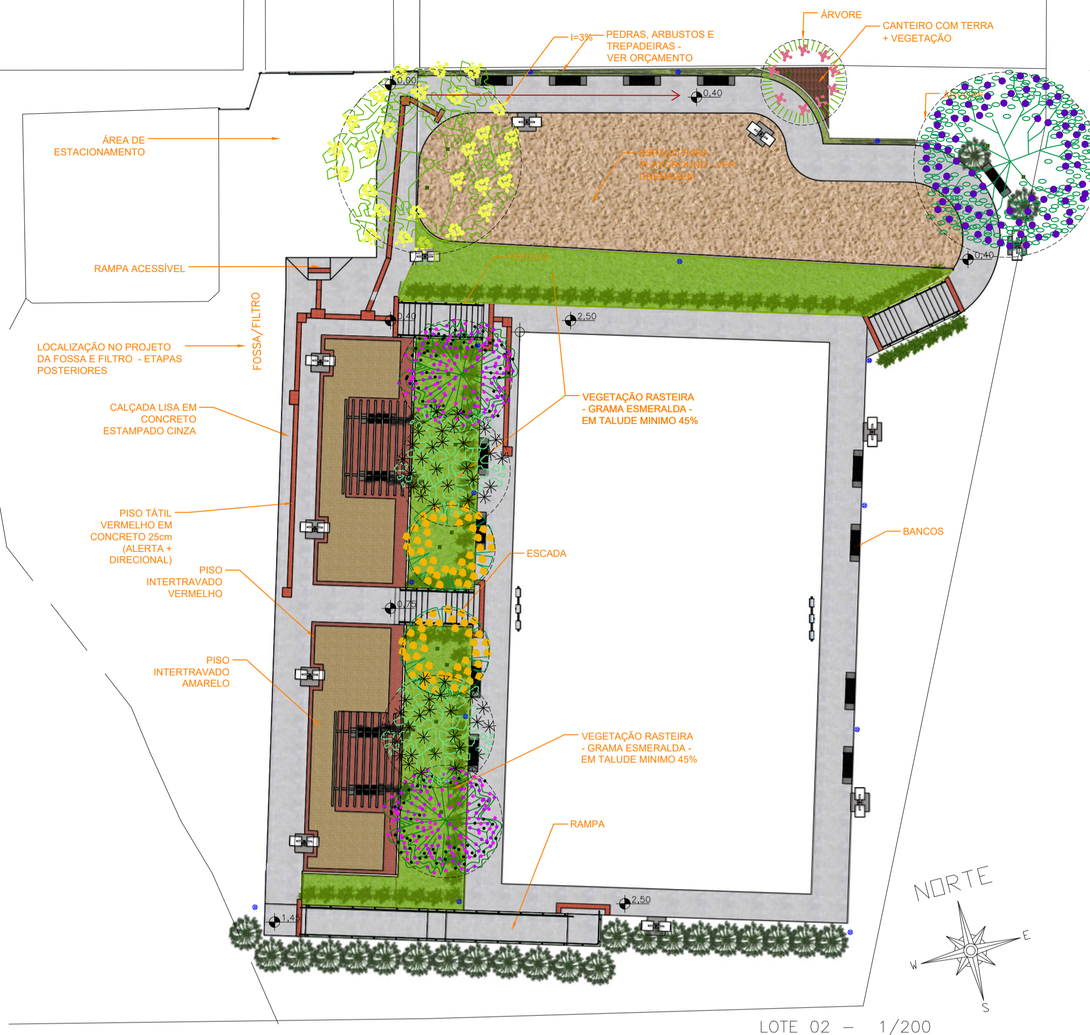
LOTE 02 - 1/200