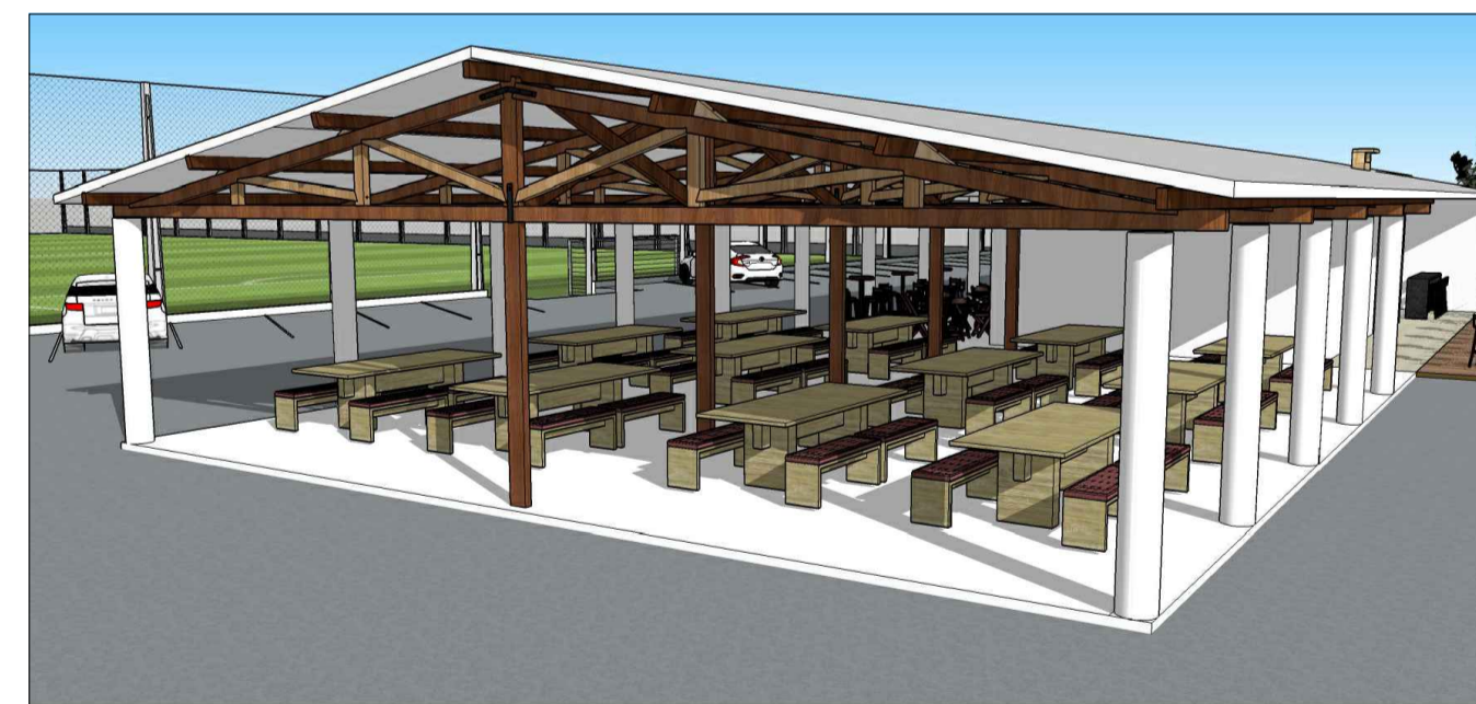
PERSPECTIVA ÁREA DE AMPLIAÇÃO ESCALA 1/500