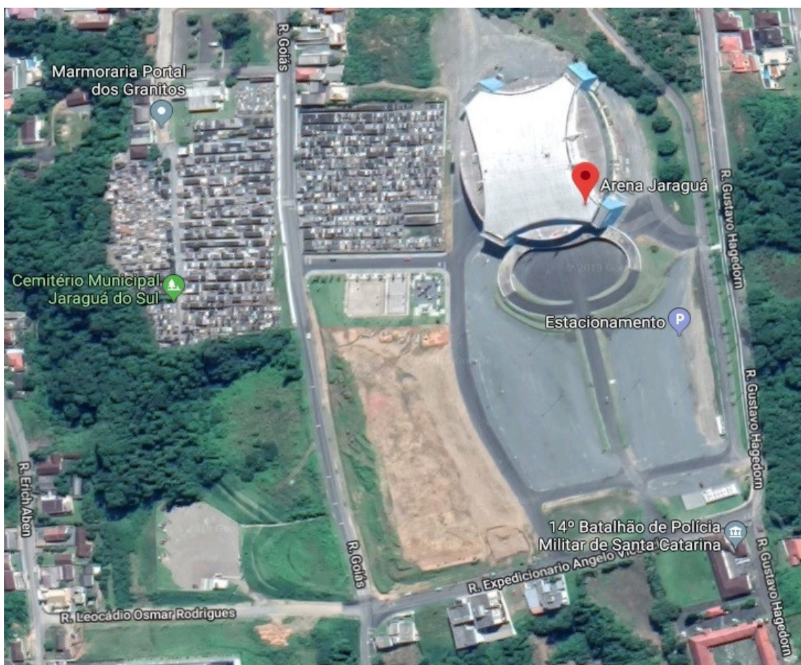
Imagem 01: Localização do imóvel

O presente memorial descritivo, em conjunto com o projeto anexo (prancha gráfica), tem por finalidade orientar a contratação de pessoa jurídica especializada para prestação de serviços de engenharia, com fornecimento de materiais, equipamentos, ferramentas e mão de obra necessários à execução dos serviços de reforma e pintura das torres da Arena Jaraguá, localizada na Rua Gustavo Hagedorn nº 636, Bairro Nova Brasília, no Município de Jaraguá do Sul/SC, em conformidade com o Estudo Técnico Preliminar, Projetos, Termo de Referência, Memorial Descritivo e Planilha Orçamentária/Quantitativa.