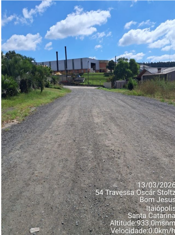
13/03/2026 54 Travessa Oscar Stoltz Bom Jesus Itaiópolis Santa Catarina Altitude:933.0msnm Velocidade:0.0km/h