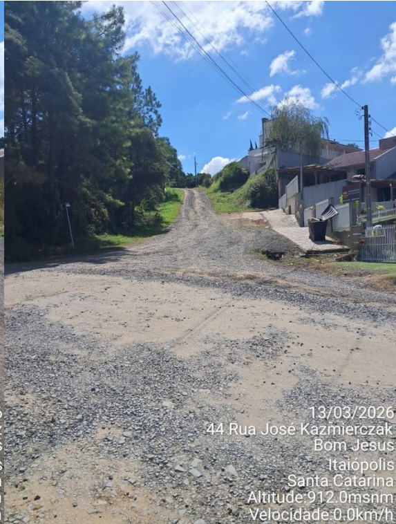
13/03/2026 44 Rua José Kazmierczak Bom Jesus Itaiópolis Santa Catarina Altitude:912.0msnm Velocidade:0.0km/h