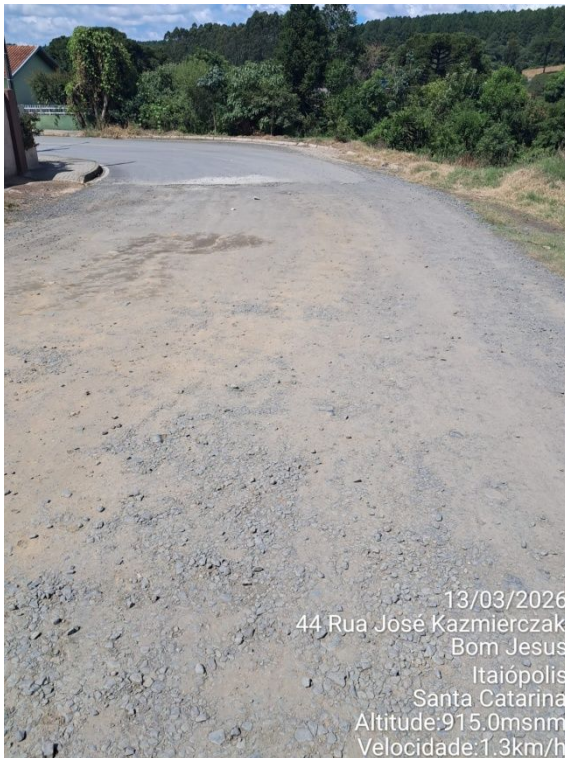
13/03/2026 44 Rua José Kazmierczak Bom Jesus Itaiópolis Santa Catarina Altitude:915.0msnm Velocidade:1.3km/h