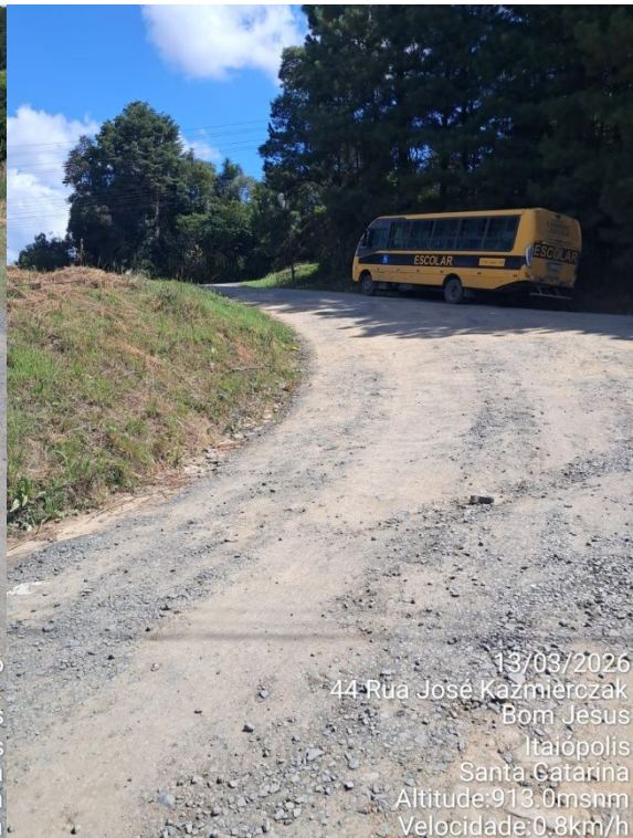
13/03/2026 44 Rua José Kazmierczak Bom Jesus Itaiópolis Santa Catarina Altitude:913.0msnm Velocidade:0.8km/h