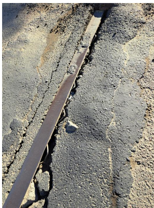
Figura 02 – Exposição armadura de chumbamento das cantoneiras metálicas