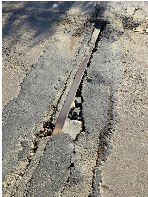
Figura 03 – Perda de seção da junta de dilatação