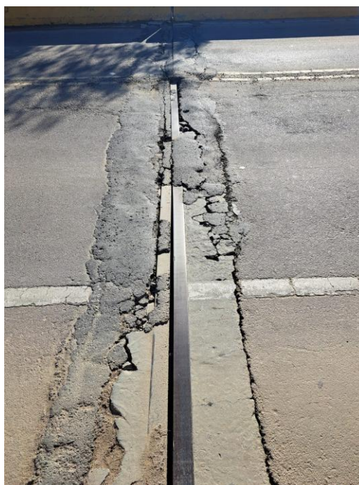
Figura 04 – Deslocamento total entre berços de concreto e pista de rolamento