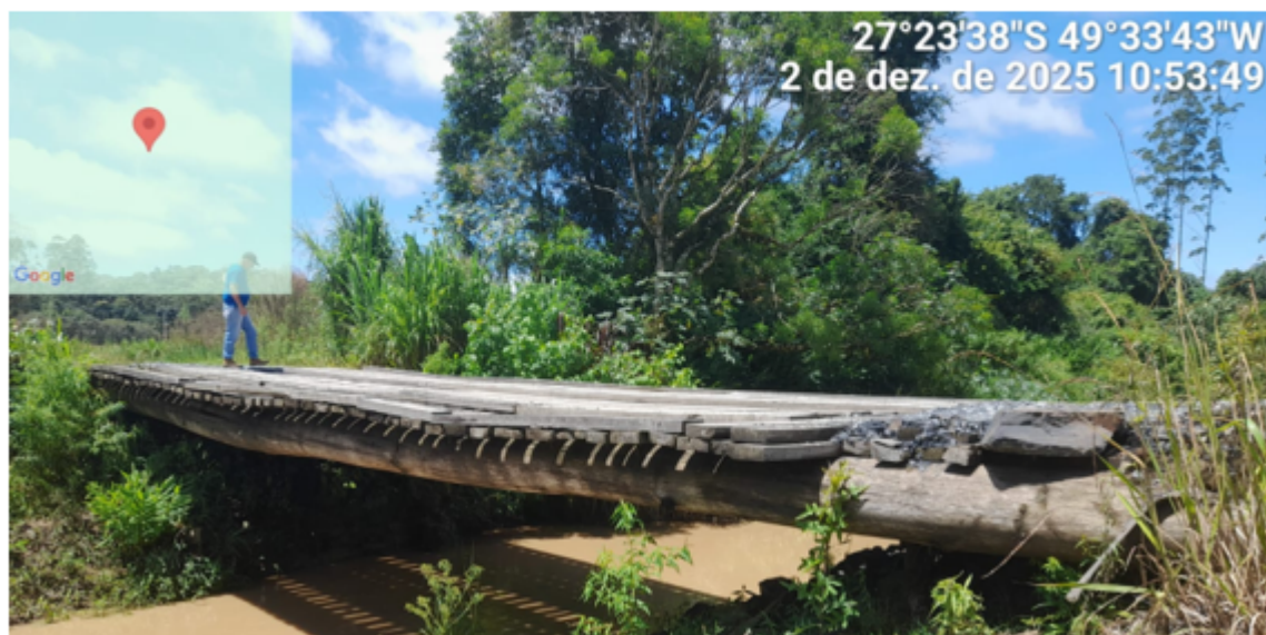
Figura 2 – Ponte na localidade de Rio Batalha - 12 Metros

ESTE DOCUMENTO FOI ASSINADO EM: 16/06/2026 16:42:03.00 -03 PARA CONFERENCIA DO SEU CONTEUDO ACESSSE: https://c.ipm.com.br/pr12e6c7318faa