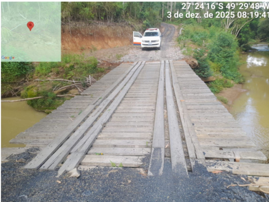
Figura 4 - Ponte Rio Areias - 13 Metros

As imagens acima possuem caráter meramente exemplificativo e representam apenas parte das pontes de madeira existentes na malha viária municipal, não abrangendo a totalidade das