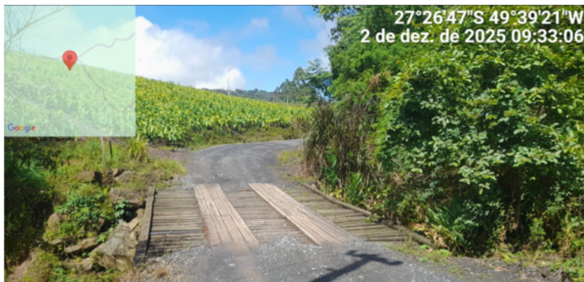
Figura 1 – Ponte na localidade de Alto Braço Primbo - Tifa Mees - 11 Metros