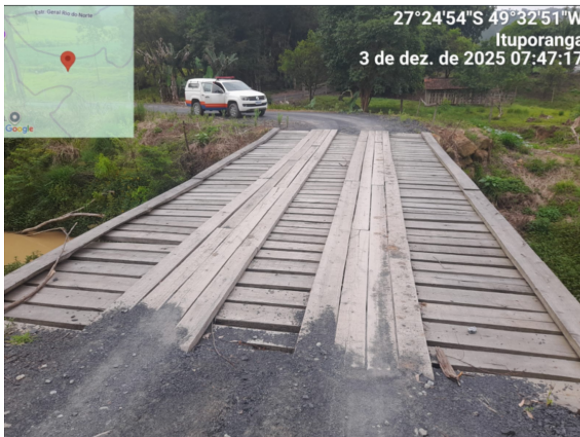
Figura 3 – Ponte na localidade de Rio Batalha - Tifa Hentz - 12 Metros