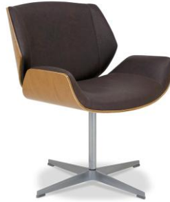
Imagem meramente ilustrativa, desconsiderar a cor do couro desta imagem.