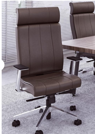
Imagem referência de modelo e de cor do couro natural.