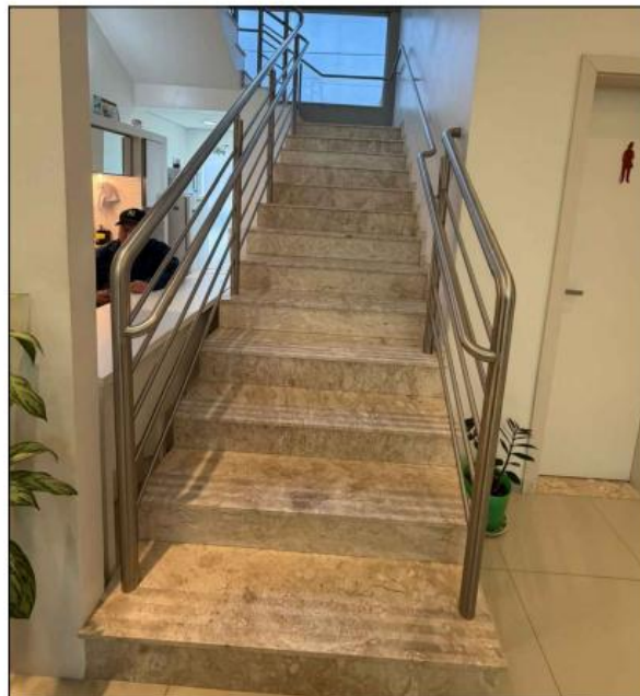
MODELO DE GUARDA-CORPO A SER SEGUIDO