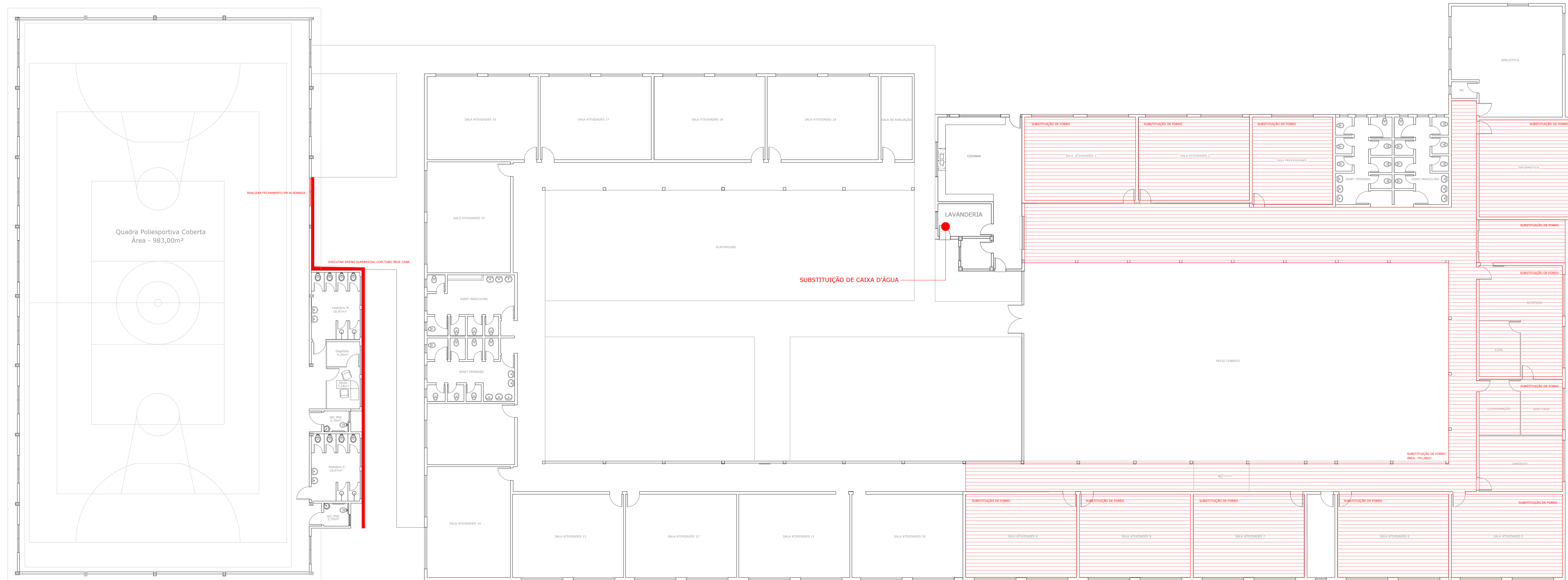
CROQUI DE INTERVENÇÃO ESCALA: 1:200

PROJETO: MELHORIAS E COMPLEMENTAÇÕES - NÚCLEO MUNICIPAL GETULIO VARGAS ENDEREÇO DA OBRA: RUA PRUDENTE VISCONDE DE MORÃES, GETÚLIO VARGAS - CURITIBANOS 89520-000 SECRETARIA DA EDUCAÇÃO E CULTURA: ANDRESSA BOSCARI DE FARIAS ARQUITETO: KAIO CÉSAR MATTOS DATA: DPTO. TÊC DE ENG. E ARQ. ARQUITETO: KAIO CÉSAR MATTOS DESENHISTA: ISADORA ALVES DE LIMA FRANCHA: