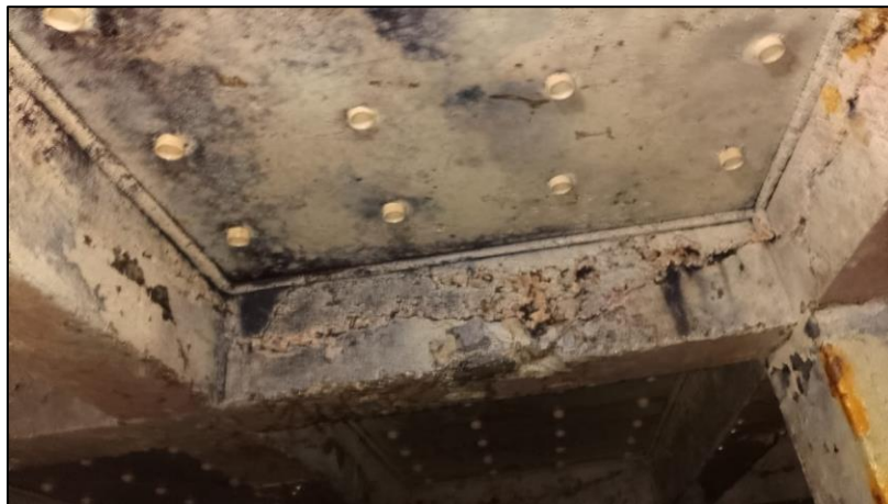
Figura 4 - Laje de fundo falso vista inferior com risco iminente de colapso - Fotos filtro 4