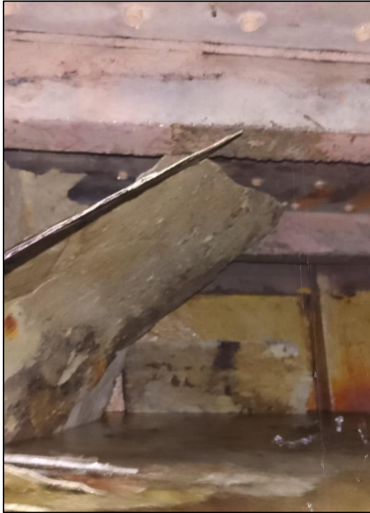
Figura 2- Deslocamento da fibra de impermeabilização estrutura de concreto comprometida – Fotos filtro 4