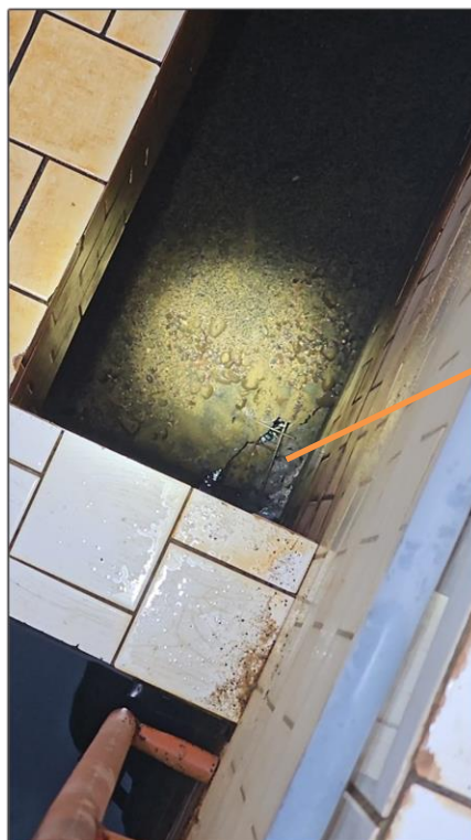
Laje rompida – armadura aparecendo