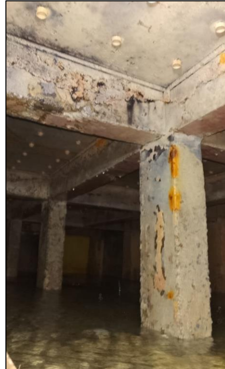
Figura 3- Fissuras aparentes e patologias graves nas vigas, pilares e lajes que sustentam o fundo falso- Fotos filtro 4