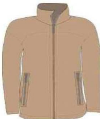
Figura 07 – Parte Interna