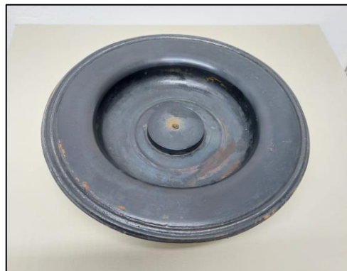
Figura 1 e 2 Diafragma compatíveis com as marcas Bermad, Redutech e RBA