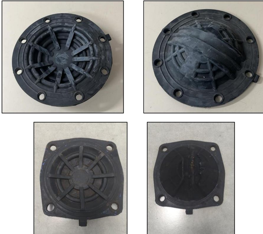
Figuras 3 a 6 - Modelo diafragma compatíveis com as marcas Bugatti/VHM200 e Conexo/FD2020.