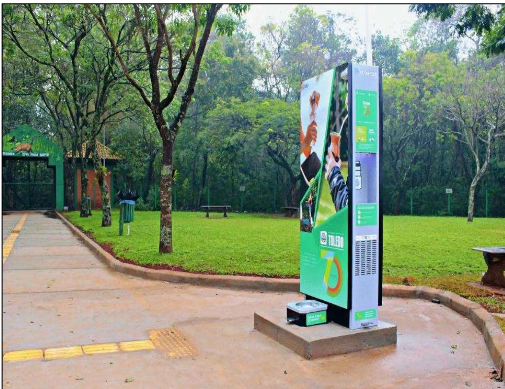
Figura 1 - Cidade de Toledo/PR

1.3.6.1. Como referência de qualidade e funcionalidade, e para melhor compreensão dos equipamentos desejados, seguem modelos que já foram implementados em outras localidades.