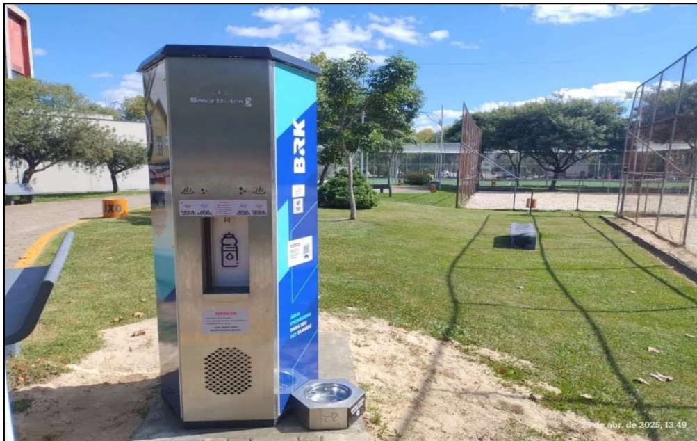
Figura 2 - Cidade de Caçador/SC - https://portalrbv.com.br/cotidiano/saude/instalado-o-primeiro-chimarrodro-mo-em-cacador/

1.4. O custo estimado para contratação do objeto é de R$ 257.351,50 (Duzentos e cinquenta e sete mil, trezentos e cinquenta e um reais, e cinquenta centavos), conforme custos apostos na tabela acima obtida em pesquisa de preços de mercado.