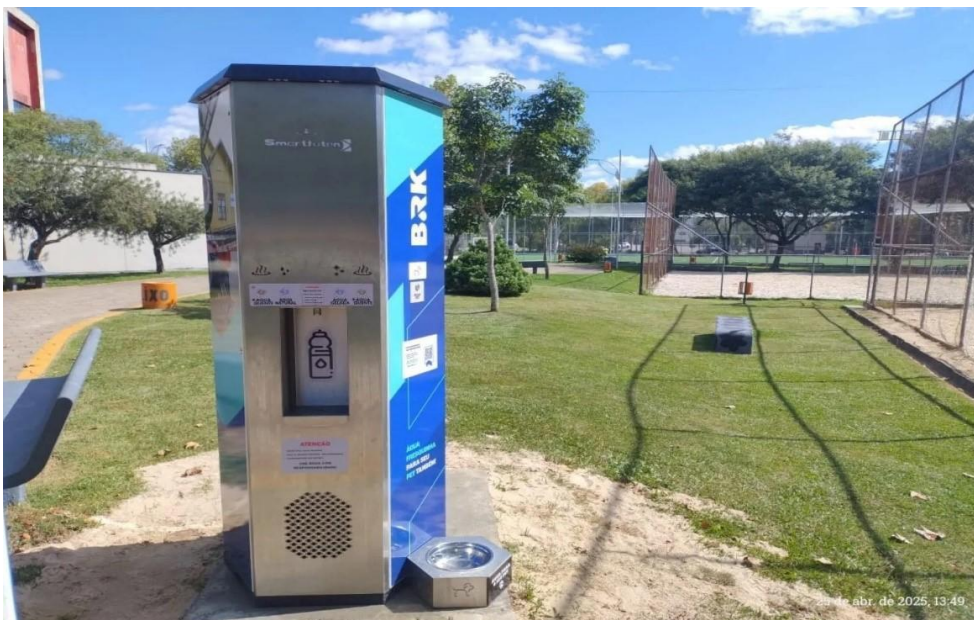
Figura 2 - Cidade de Caçador/SC - https://portalrbv.com.br/cotidiano/saude/instalado-o-primeiro-chimarrodoro-em-cacador/

Rua: Erwino Menegotti, 478 – Água Verde - Jaraguá do Sul - SC 89254-000 - Telefone: (47) 2106-9100 – www.samaejs.com.br