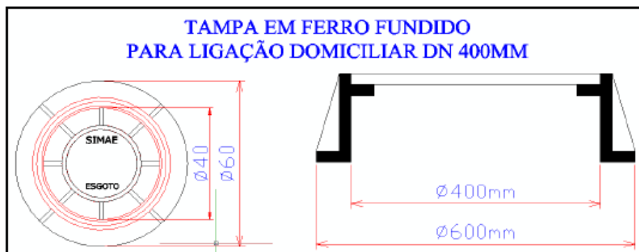
Figura 1 - Modelo tampão Simae DN 400 mm

19.9 CAIXAS DE LIGAÇÃO: durante a construção da rede coletora, serão executados, ao mesmo tempo, as ligações prediais. Cada ligação domiciliar compreende a ligação do coletor público à caixa concentradora, na qual poderão ser ligados, no máximo, três prédios, a critério da fiscalização do Simae, obedecendo ao modelo padrão tipo Simae. O terreno deverá ser escavado e compactado no fundo para posterior colocação de uma berço de areia ou pó de pedra com, no mínimo, 5,0 cm (cinco centímetros) de espessura após a compactação. As paredes das caixas serão confeccionadas em tubos de concreto pré-moldado DN 400 mm (quatrocentos milímetros) e os tampões em ferro fundido envolvidos, quando for o caso, em anéis de concreto. Os tubos e os tampões serão cimentados e rejuntados com argamassa plástica de cimento e areia no traço 1:3 (cimento:areia). O fundo da caixa de ligação também deverá ser preenchido com argamassa plástica de cimento e areia no traço 1:3. Após o preenchimento do fundo, com uma colher de pedreiro, deverá ser realizado uma calha para o direcionamento do fluxo. O tampão a ser utilizado deverá ser em Ferro Fundido, DN 400 mm, articulado, Classe 125 KN, modelo utilizado pelo Simae. Não será aceito outro tipo de modelo de tampa de ferro sem que seja o modelo adotado pelo Simae. Para a tampa das Caixas de Ligação deverá ser utilizado concreto armado com Fck de, no mínimo, 25 Mpa com armaduras compostas por barras de aço CA – 50 de 10 mm de diâmetro dispostas em malha.