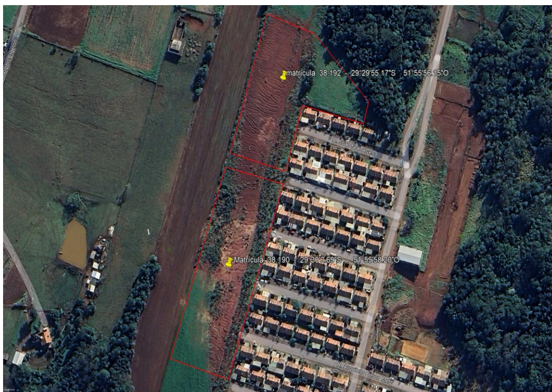
Figura 1: Planta de Localização do empreendimento Loteamento IPÊ, Bairro: Novo Paraíso, Estrela. (Fonte: Google Earth 17/09/2024). Matrículas nº 3.190 e 3.192.

Obedecerá as diretrizes estabelecidas nas seguintes Portarias, nº 724, 725 e 727 do MCID, de 15 de junho de 2023, com particularidades da Portaria 704 do MCID, de 17 de julho de 2024, conforme a localização a seguir: