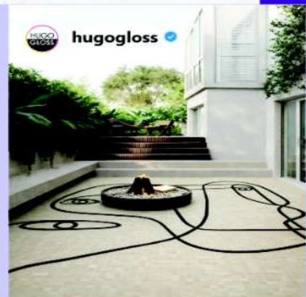
Piscina e piso da casa - Hugo Gloss