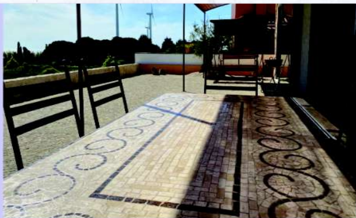
Mesa em mosaico romano - Aveiro, Portugal