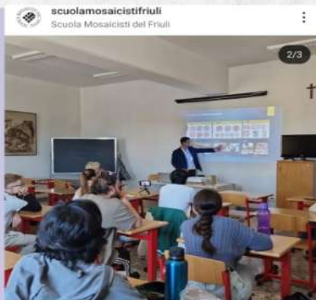
Palestra na Scuola Mosaicisti - Itália