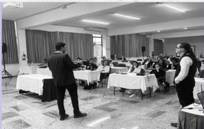
Professor da Pós-Graduação PUC - RS