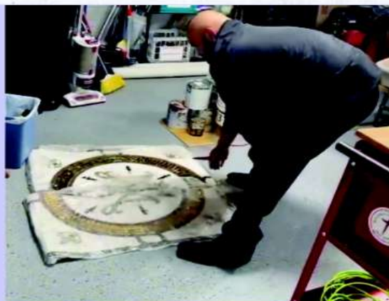
Brasão sacro - Dallas, Texas - EUA