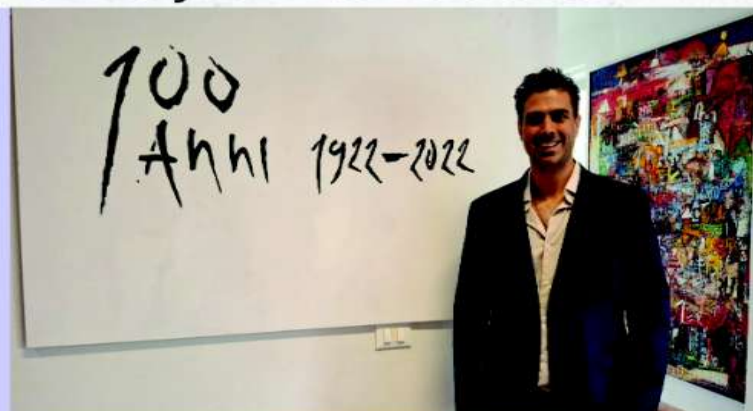
Formado na Scuola Mosaicisti del Friuli - Itália