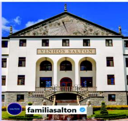
Fachada da Vinícola Salton