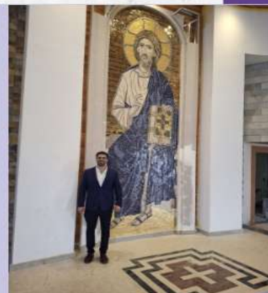
Pantocrator de Arthur Nogueira - SP