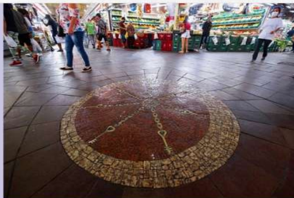
Bará do Mercado - Mercado Público de Porto Alegre