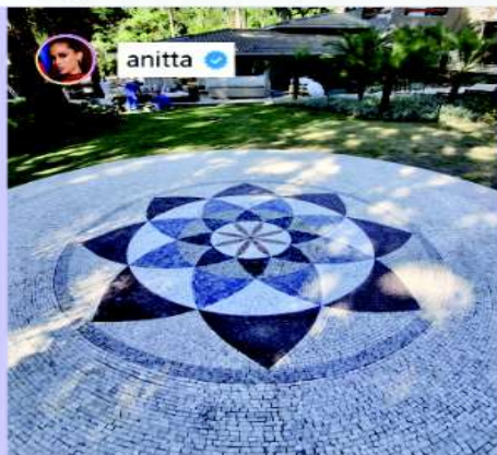
Mandala em mosaico da Casa da Anitta