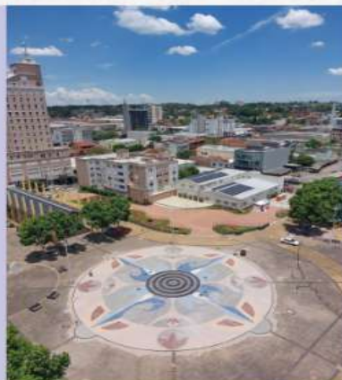
Rosa dos ventos - Campo Bom - RS