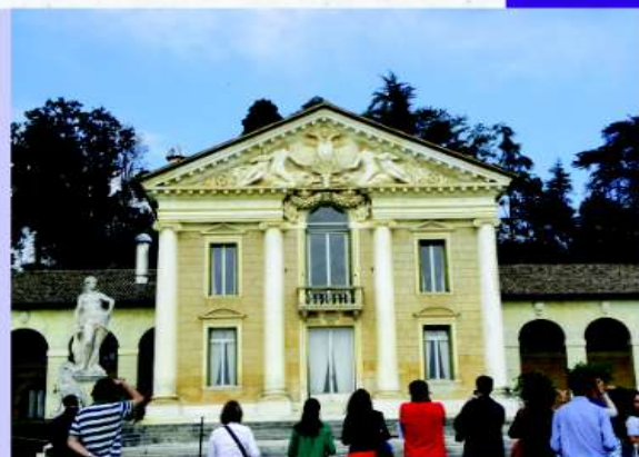
Pós em arquitetura Clássica - Vicenza, Itália