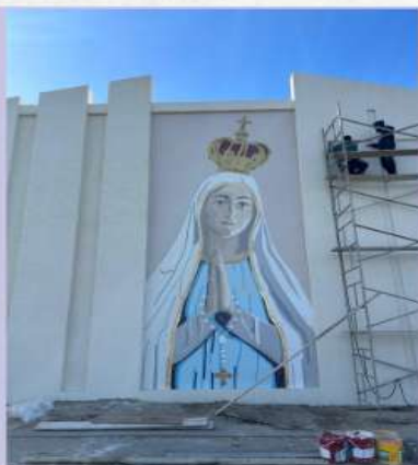
N. S. de Fátima - Xangri-lá - RS