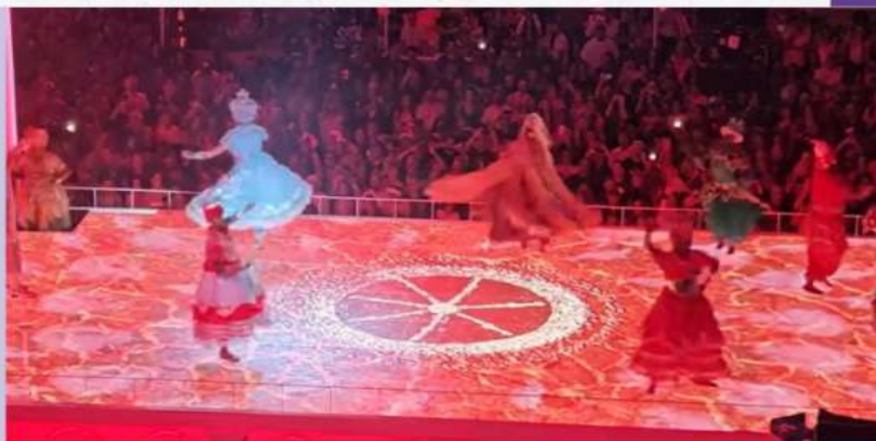
Projeção do nosso mosaico no carro abre alas da Portela - 2026