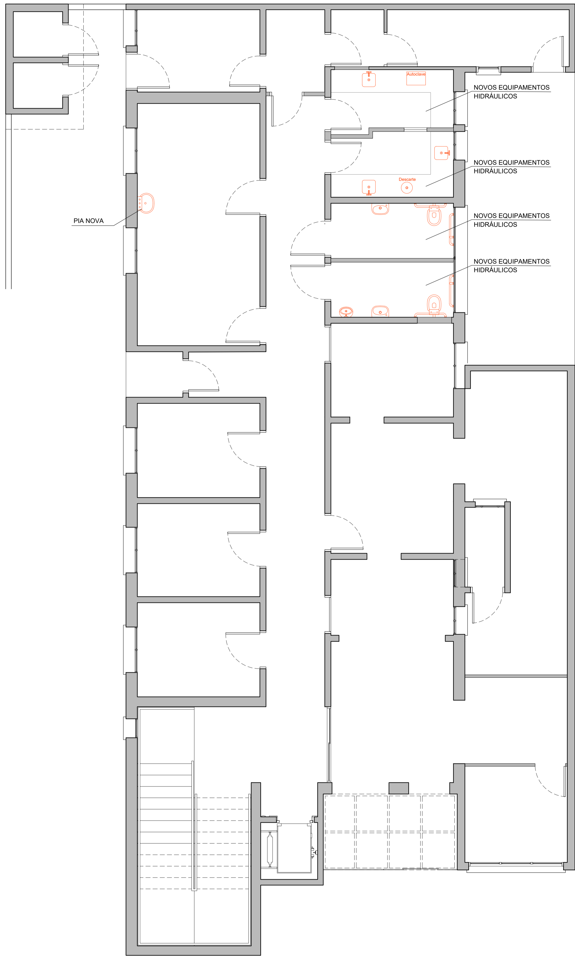
PAVTO. INFERIOR REFORMA PISO ESCALA 1/50