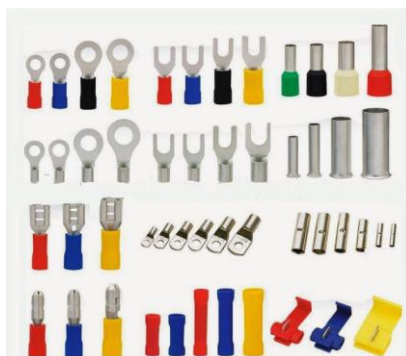
Figura 10: Conectores elétricos diversos

As conexões entre condutores deverão ser feitas através de emendas, sem interrupção do ramal principal. Estas emendas devem ser protegidas por fita isolante.