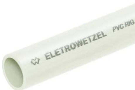
Figura 7: Eletroduto PVC rígido branco

Os eletrodutos utilizados na edificação para distribuição dos circuitos serão de PVC rígido na cor branca, com conexão do tipo soldável ou rosca, os eletrodutos terão seção nominal indicada na planta. Cabe salientar que a seção mínima de eletroduto adotada em projeto é de 1" mesmo quando não houver indicação da seção em planta.