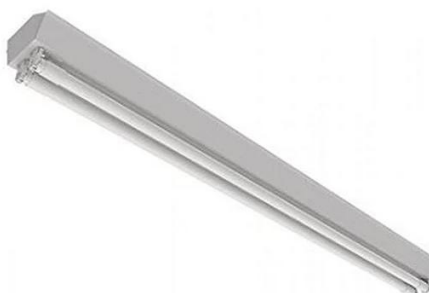
Figura 11: Luminária tipo calha para 2 lâmpadas T8

Para a iluminação interna será utilizado luminárias do tipo calha para duas lâmpadas tubulares T8 de 120 cm.