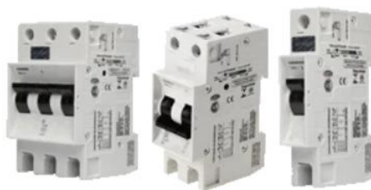
Figura 2: Minidisjuntores IEC/DIN

Para proteção e seccionamento dos circuitos elétricos terminais, serão utilizados disjuntores termomagnéticos, padrão IEC e DIN, em conformidade com as normas NBR NM 60947-2 e NBR IEC 60898-1.