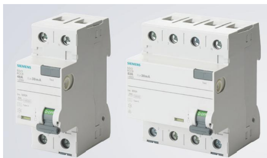
Figura 3: Interruptor Diferencial Residual (IDR)

As instalações elétricas da edificação possuirão proteção contra choque elétrico através de interruptor diferencial residual, IDR, com sensibilidade de 30 mA nos barramentos de entrada protegendo todos os circuitos.