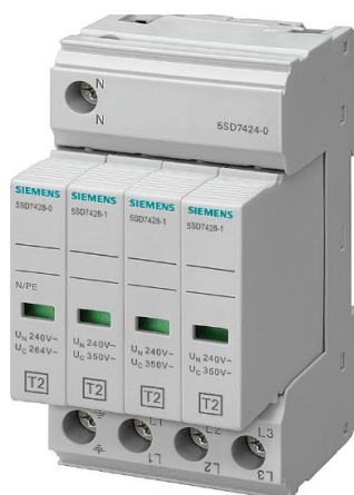
Figura 4: Dispositivo de proteção contra surtos

Serão utilizados quatro dispositivos de proteção nos quadros de distribuição, interligando cada fase e o neutro ao aterramento.