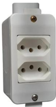
Figura 5: Tomada dupla em condutele PVC de 1 polegada

Todas as tomadas deverão estar em conformidade com a NBR 14136.