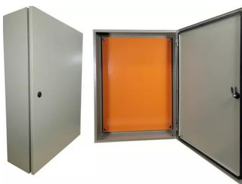
Figura 1: Quadro 800x600 sem flange.

O quadro deverá ser fabricado em chapa de aço com pintura eletrostática a pó na cor bege e dispor de fundo laranja para montagem, a montagem deve obrigatoriamente seguir o layout apresentado na prancha E2.