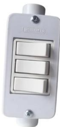
Figura 6: Interruptor simples 3 teclas em condutele PVC de 1 polegada

Os interruptores serão instalados sobrepostos em condutes de 1", sendo eles com 1 tecla ou mais, simples, conforme indicado no projeto, deverão sempre estar instalados a uma altura de 1,20 m a contar do piso acabado.