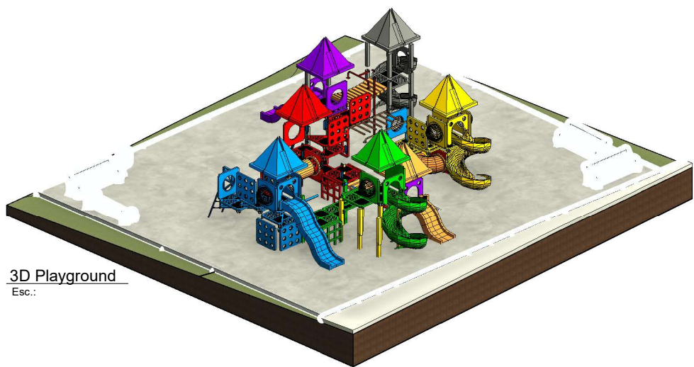
3D Playground Esc.: