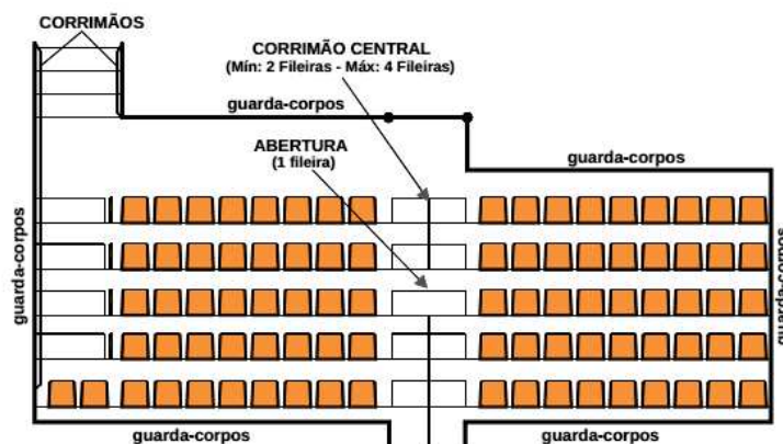
Figura 04 – Disposição dos corrimãos nos acesso radial

5.3.2.2.7 A inclinação máxima admitida para os setores de arquibancada é de 32°, medida entre a primeira fila e a última, tendo como base a cota inferior dos degraus das arquibancadas em relação à linha horizontal.