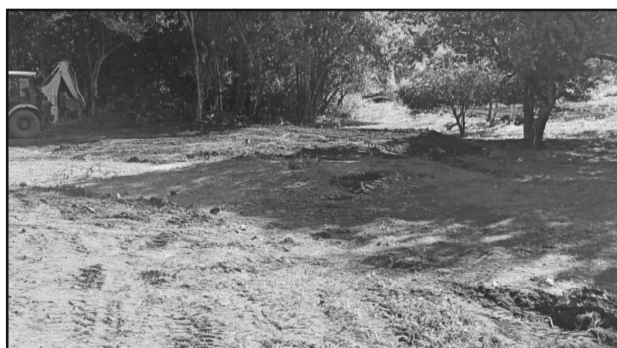
Prestação de serviços de pequeno porte para Roque Kunrat, na Linha Orion.