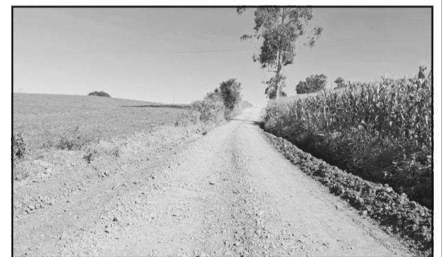
Recuperação de estradas na Linha Rolador Baixo.