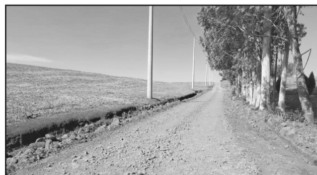
Recuperação de estradas na Linha Vênus.