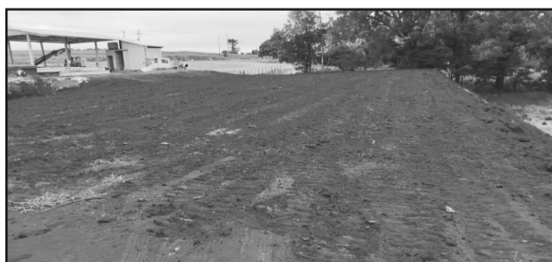
Prestação de serviços para a empresa Metalúrgica Aliança na Linha Rolador Alto, pelo Programa Investa Mais.