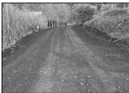
Recuperação de estradas na Linha Orion.