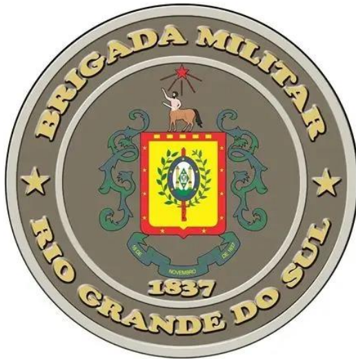
Imagem manga direita esquerda