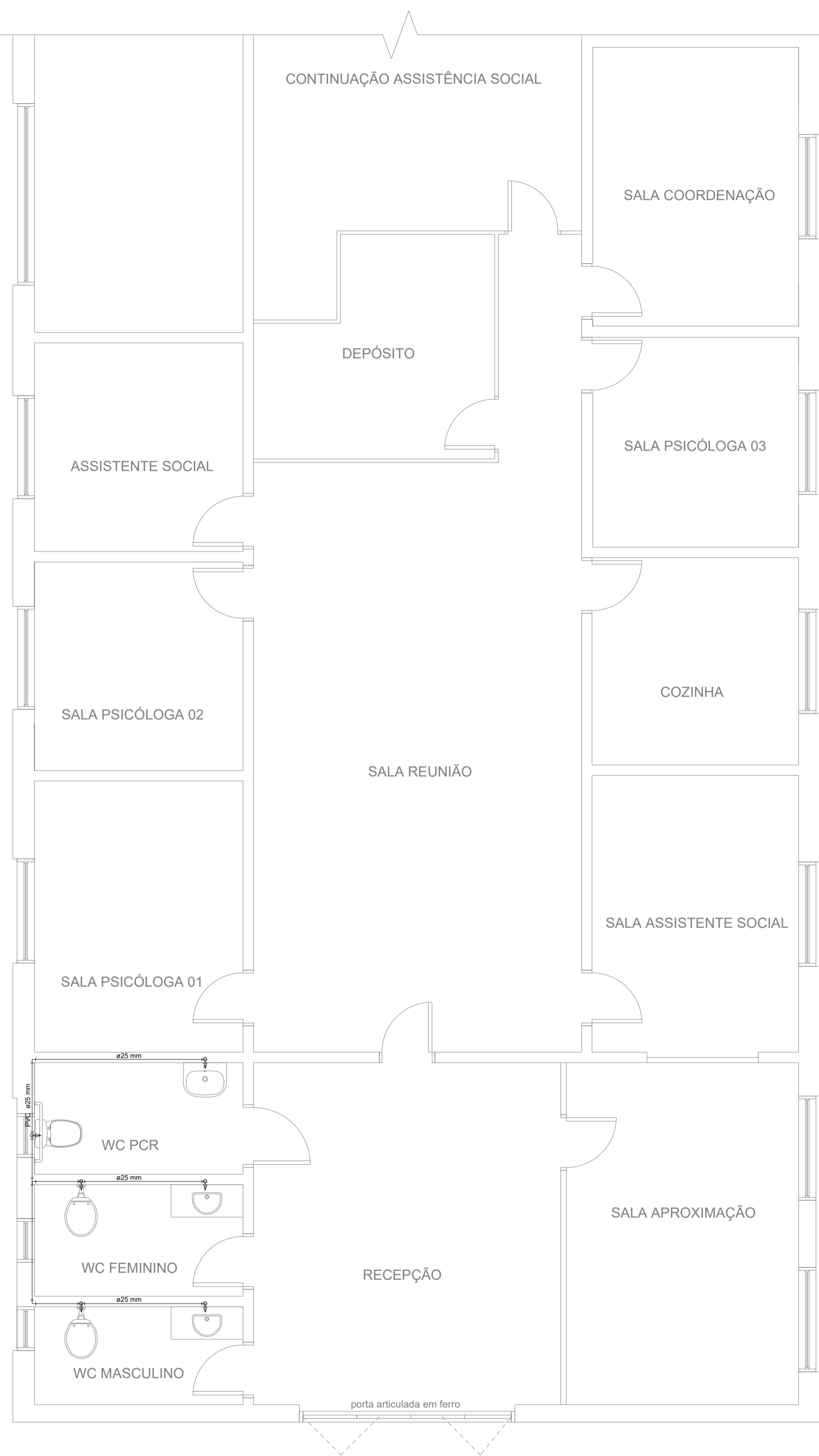
10 PLANTA HIDRÁULICA ESC. 1/50