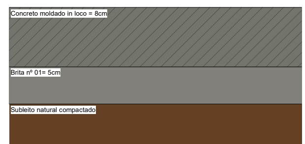
4 DETALHE CORTE A-A ESCALA 1 : 5