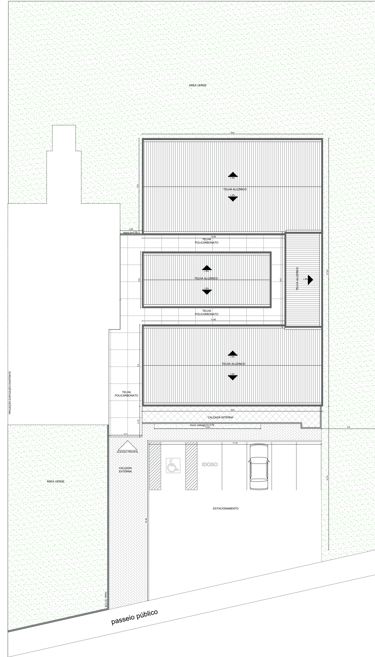
1 PLANTA DE LOCALIZAÇÃO E COBERTURA Área construída: 580m 2 1 : 200